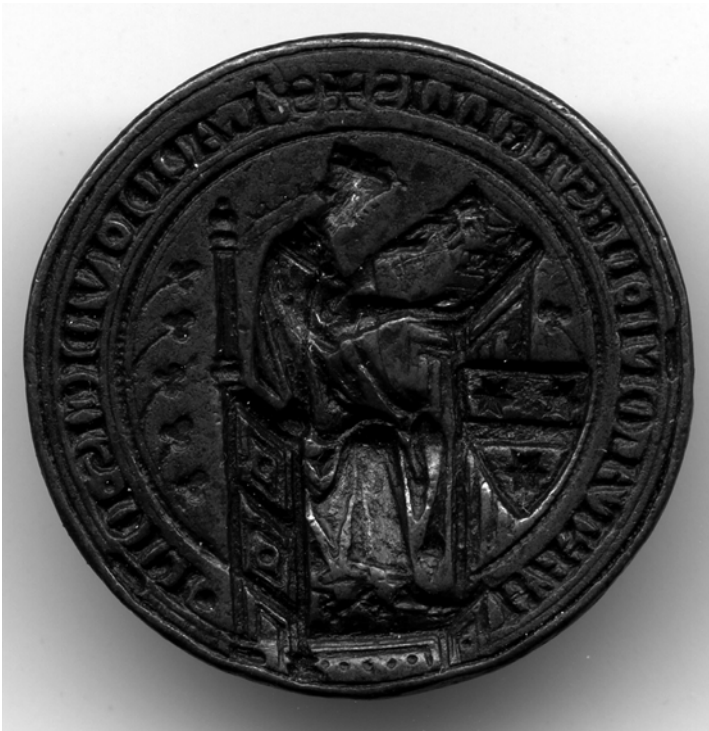
Bild 6: Siegelstempel des Richters Lando delle Stelle (Siena, Museo Civico, Inv. Nr. 201)

Die Siegelabdrücke der drei Rechtsgelehrten zeigen also ein sorgfältig konstruiertes Bildformular, das jeweils in allen Details auf kleinster Bildfläche wiederholt wird, auch wenn deutlich künstlerische Unterschiede erkennbar sind. Auch die oben erwähnten Siegelstempel des Richters Lando delle Stelle und des Rechtsdoktors Biagio Montanini visualisieren dieses Bildformular in wichti-