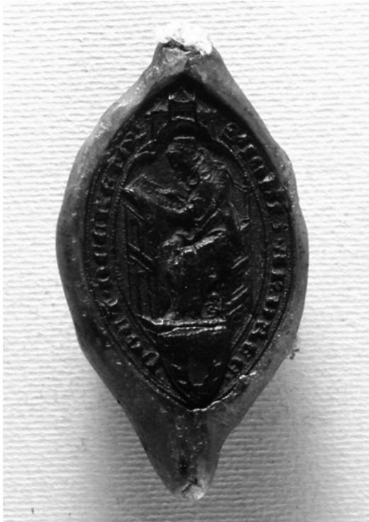
Bild 3: Abdruck des Siegels von Giovanni d'Andrea vom 9.5.1329 (Florenz, Archivio di Stato, »sigilli staccati«, Nr. 83)

Das Gutachten Giovanni d'Andrea vom 9. Mai 1329 veranschaulicht auf plastische Weise die Dominanz des Bildmotivs des doctor in cathedra auf Siegelabdrücken an Rechtsgutachten, auf die bereits Robert Davidsohn in seiner Geschichte von Florenz aus dem Jahr 1925 aufmerksam machte. 16 Davidsohns Hinweis blieb in der Siegelkunde unbeachtet, unter anderem deshalb, weil die