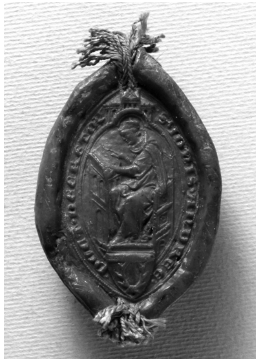
Bild 8: Abdruck des Siegels von Giovanni d'Andrea vom 30.5.1315 (Florenz, Archivio di Stato, »sigilli staccati«, Nr. 62)

Auf dem Siegelstempel aus dem Museo Civico in Bologna beansprucht das Wappen weit aus mehr Bildraum als auf den Abdrücken des Florentiner Staatsarchivs, auf denen die Figur des Rechtsgelehrten im Vergleich größer veranschaulicht werden kann. Das Bildfeld, in dem das