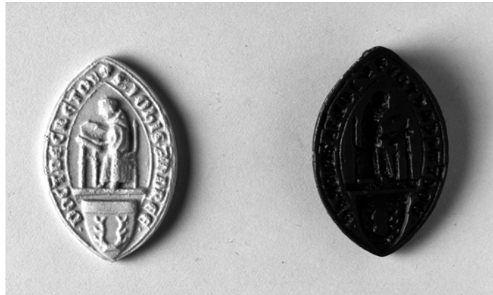
Bild 7: Siegelstempel des Giovanni d'Andrea (Bologna, Museo Civico Medievale, Inv. Nr. 3929) und moderner Abguss dieses Stempels

In wichtigen Grundzügen ist das Bildformular, mit dem das Motiv des Doctor in Cathedra auf den Siegelabdrücken Giovanni d'Andrea, Giovanni Calderinis und Filippo Formaglinis präsentiert wird, also bereits zu Beginn des 14. Jahrhunderts in Italien ortsübergreifend verbreitet. Das bezeugt auch ein Siegelstempel Giovanni d'Andrea, der heute im Museo Civico Medievale in Bologna aufbewahrt wird und der ein anderer sein muss als derjenige, der die Siegelabdrücke von 1329 produziert hat (Bild 7). Dieser Siegelstempel wurde im Jahr 2006 in der Ausstellung Giotto e le arti a Bologna al tempo di Bertrando del Poggetto präsentiert. 26 Er ist spitzoval und die Siegelumschrift lautet wie die der Abdrücke aus dem Jahr 1329: S(igillum) Ioh(ann)is Andree Doct(or)is Decretor(um) . Aus stilistischen Gründen wird der Stempel im Katalogbeitrag auf das Ende des 13. bzw. den Anfang des 14. Jahrhunderts