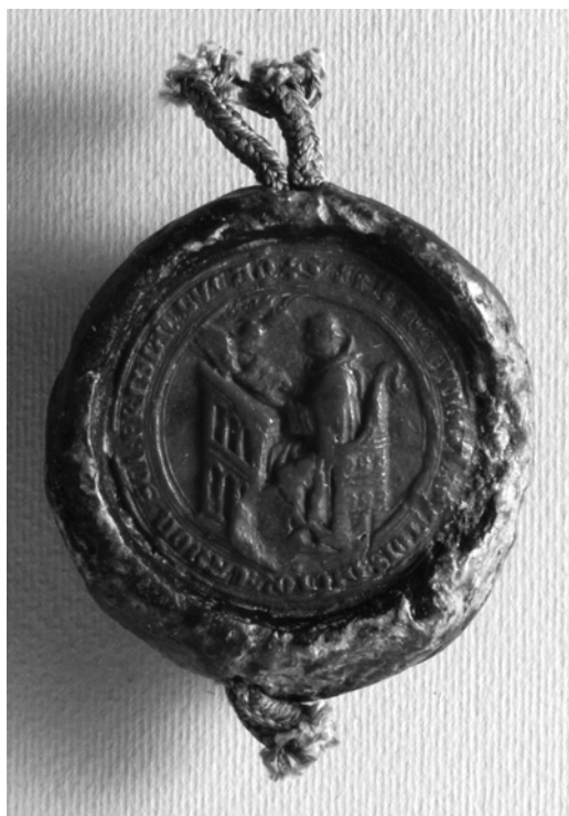
Bild 9: Abdruck des Siegels des Rechtsdoktors Boncius vom 7.8.1313 (Florenz, Archivio di Stato, »sigilli staccati«, Nr. 61)

Der gut erhaltene Abdruck des Siegels von Boncius ist im Gegensatz zu den Siegelabdrücken am Gutachten Giovanni d'Andreas nicht spitzoval, sondern rund und etwas kleiner (Bild 9). Wieder sehen wir links ein Pult in perspektivischer Verkürzung mit einer doppelten Reihe von schmalen Rundbögen und rechts eine Kathedra und den in ihr thronenden Rechtsgelehrten vor einer