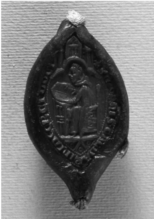
Bild 5: Abdruck des Siegels von Giovanni Calderini vom 9.5.1329 (Florenz, Archivio di Stato, »sigilli staccati«, Nr. 84)

In Italien bedeutet Siegelforschung dagegen in erster Linie die Untersuchung von Siegelstempeln, die sich in großer Anzahl erhalten haben und in den beiden größten Sammlungen des Florentiner Nationalmuseums, dem Bargello, und im Palazzo Venezia in Rom wie auch in vielen kleineren Museen zusammengeführt sind. Die immer noch grundlegende Untersuchung zu italienischen