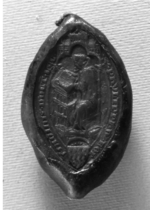
Bild 4: Abdruck des Siegels von Filippo Formaglini vom 9.5.1329 (Florenz, Archivio di Stato, »sigilli staccati«, Nr. 86)