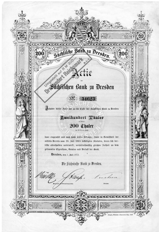
Abb. 5. Deutsches Reich, Aktie der Sächsischen Bank zu Dresden, 200 Taler, 01.07.1873, umgestellt auf 300 Reichsmark, 25 × 36,6 cm, Bundesbank, Frankfurt am Main, Inv.-Nr.: SM0358