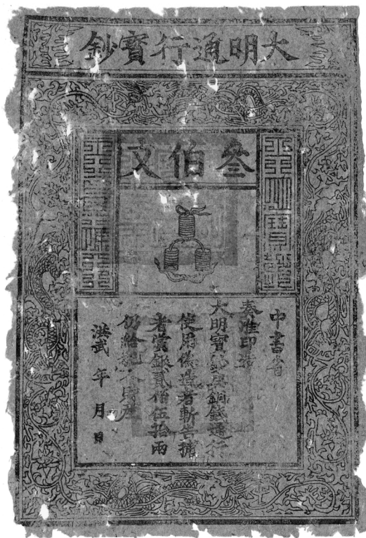
Abb. 1. China, Reichsschatzamt des Kaisers Tai Tsu (Ming-Dynastie), 300 Käschen, 1368–1399, 22,2 × 32,9 cm, Bundesbank, Frankfurt am Main, Inv.-Nr.: 0793/95

Die Compagnie de la Louisiane ou d'Occident versprach Gewinne aus der Kolonialisierung des Mississippi-Gebietes. Die Kolonie Louisiana reichte damals vom südlichen Mississippi-Delta bis ins heutige Kanada. Die Gewinnausschüttung finanzierte die Banque Générale mit den Einlagen. Aktienverkäufe, die einen Kursrutsch verursachen konnten, wurden von der Banque Royale , wie die Bank ab 1718 hieß, aufgefangen (Abb. 2).