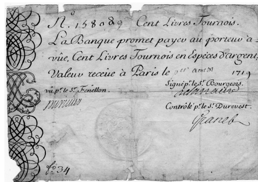
Abb. 2. Frankreich, Banque Royale, 100 Livres Tournois, 01.04.1719, 16 × 11,1 cm, Bundesbank, Frankfurt am Main, Inv.-Nr.: K 03 320

Der Erfolg der ersten Aktiengesellschaften liegt in der Zunahme des Welthandels im 17. Jahrhundert. Die europäischen Expansionsbestrebungen (»Unternehmungen«) in überseeische Gebiete wa-