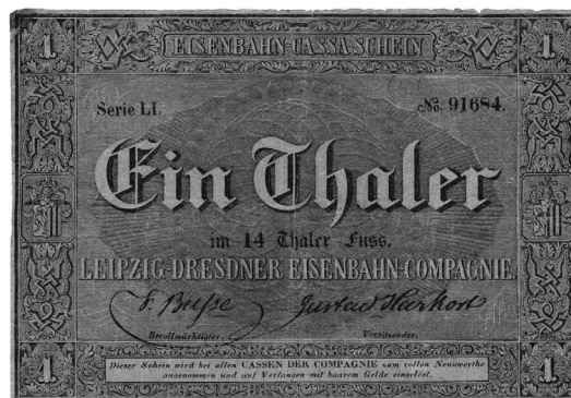
Abb. 4. Königreich Sachsen, Leipzig-Dresdner Eisenbahn-Compagnie, Kassenschein zu 1 Taler, 1838–1839, 10,5 × 7,3 cm, Bundesbank, Frankfurt am Main, Inv.-Nr.: K 00 347

deutschen Wirtschaftstheoretikers Friedrich List (1789–1846) nicht nur eine Aktiengesellschaft gegründet. Die Kompagnie erhielt zusätzlich das Recht, Geldscheine im Nennwert von einem Taler auszugeben und das Bauprojekt somit zusätzlich zu finanzieren 9 (Abb. 4).