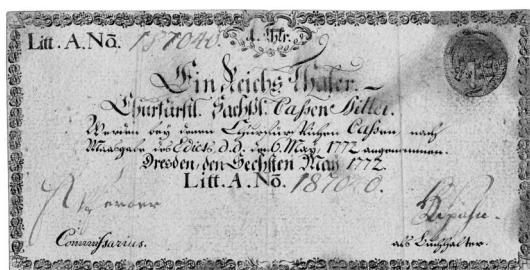
Abb. 3. Kurfürstentum Sachsen, Staatspapiergeld zu 1 Taler, 06.05.1772, 18 × 9 cm, Bundesbank, Frankfurt am Main, Inv.-Nr.: K 00 426

Dass Papiergeldemissionen bereits in der Frühzeit der Papiergeldgeschichte einer stabilen Währung nicht entgegenstanden, zeigt die Banknotenausgabe im Kurfürstentum Sachsen. Als eine der ersten Papiergeldausgaben im Heiligen Römischen Reich deutscher Nation entstanden dort im Jahr 1772 nach dem Vorbild der Wiener Stadt-Banco die sog. Zettel. Sachsens Staatspapiergeld zählte zu den bei der Bevölkerung beliebten Geldzeichen, auf die 1779 sogar ein Aufgeld gezahlt wurde. Im Kurfürstentum wurde auf eine bedachte Ausgabe von Staatspapiergeld geachtet (Abb. 3). Um